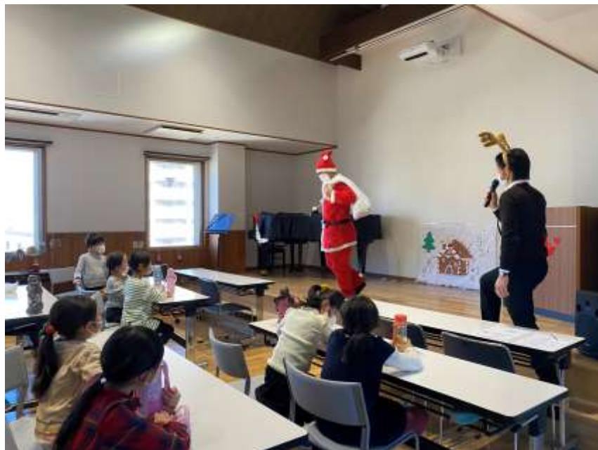
3階ホールでクリスマス会